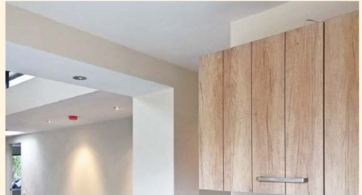
▲ Aktuelle Sanierung eines Bungalows mit Kalk-Dämmputz, Lehmputz, Naturfarben, Linoleum, Wand- und Fußbodenheizung, Solarkollektoren und Holzofen